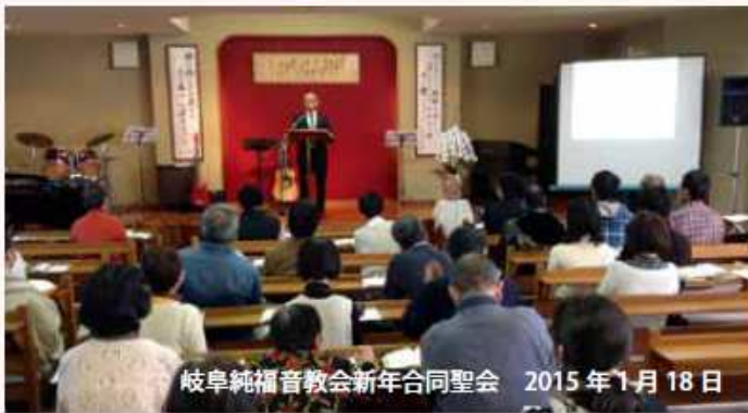
岐阜純福音教会新年合同聖会 2015年1月18日