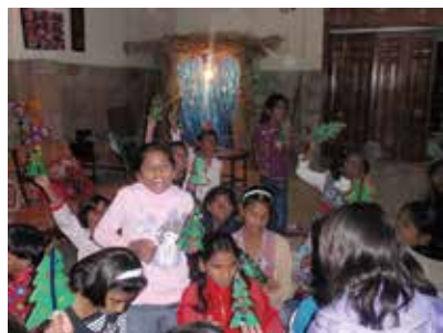
自作クリスマスツリー

こちらは、12月16日陸軍公立学校襲撃テロ事件で、いまだ病院にいる子供たちのために、教会のユースたちがクリスマスカードを作り、届けました。こちらホールでは何があるかわからないとい