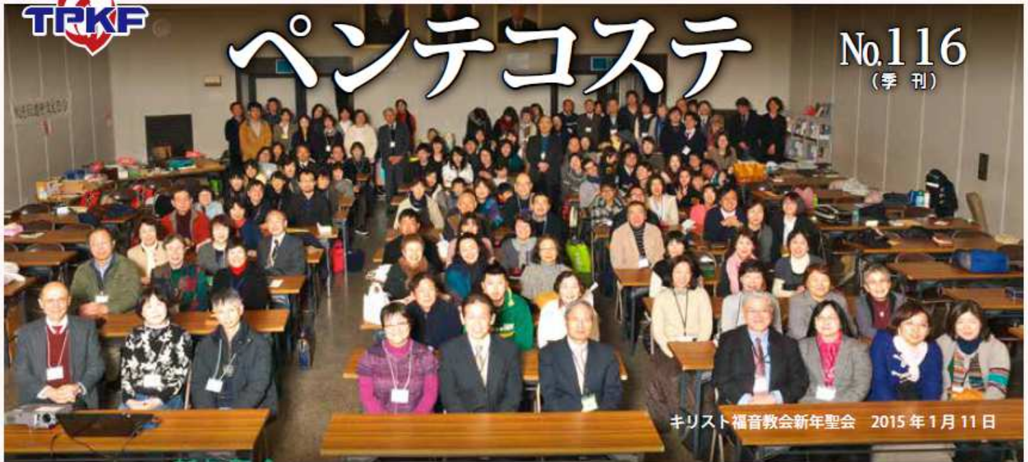
キリスト福音教会新年聖会 2015年1月11日