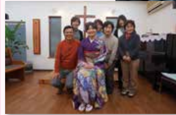
亀岡ベタニヤ教会