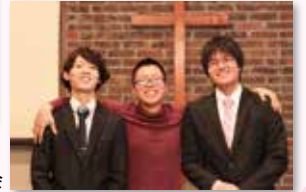
守山キリスト福音教会