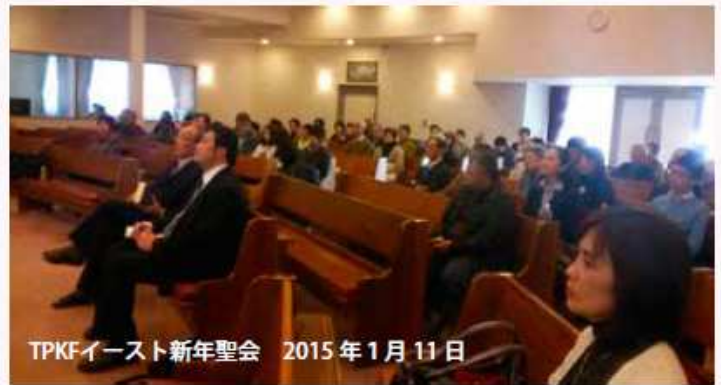
TPKFイースト新年聖会 2015年1月11日