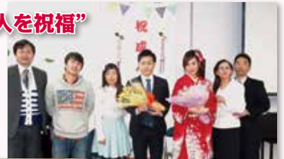
御殿場純福音キリスト教会